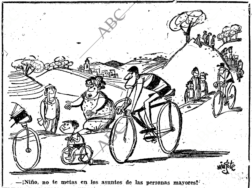
—¡Niño, no te metas en los asuntos de las personas mayores!

El seleccionador nacional, Sr. Puig, ha dicho que un "ángel malo" está influyendo en el ánimo de los corredores que integran nuestro equipo y que pretende alberar los planes que él tiene proyectados.—Mencheta.