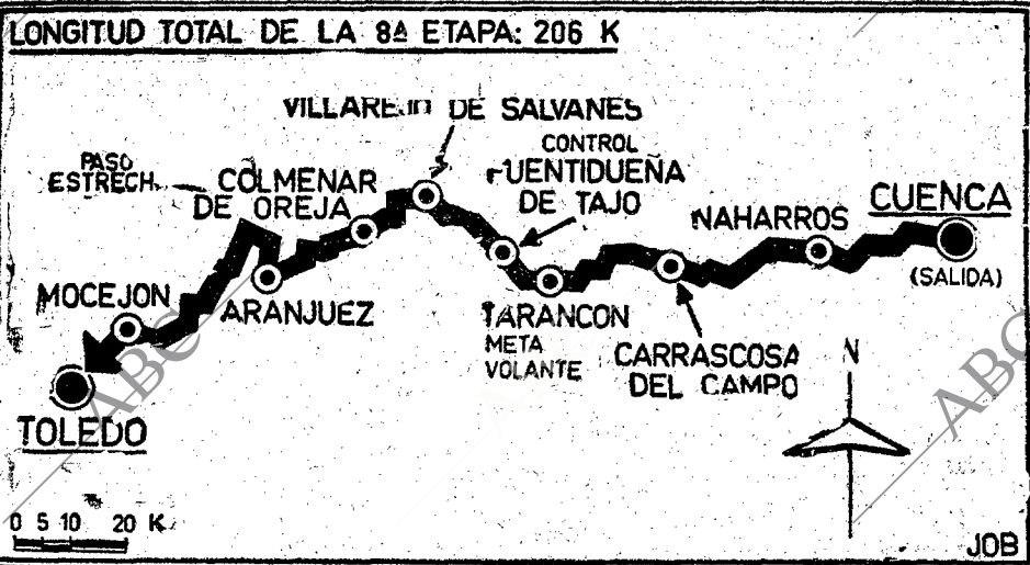
Itinerario de la etapa de hoy.