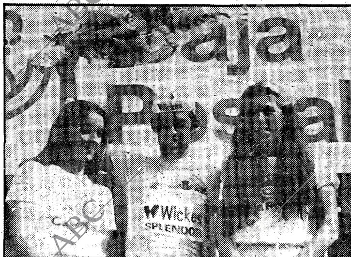
El líder, Crielion, aumentó su ventaja en la etapa de ayer.

LA ETAPA DE HOY. —Se disputa entre Zaragoza y Sabiñanigo (Huesca), con 146 kilómetros de constante ascensión hasta la cumbre del puerto de Mon-Repos, de segunda categoría. De aquí a la meta, menos de cincuenta kilómetros, que pueden aprovechar los escaladores para mantener su ventaja.