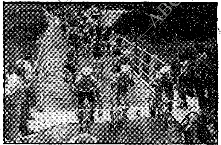
Rumbo a Albacete, el pelotón cruza el puente de Sumacárcel.

Y en la llegada, los nueve escapados entraban con algo más de minuto y medio de ventaja. Prieto, que había sido virtual «maillot» amarillo, intentó rematar la hazaña con la victoria y se lanzó pronto en un «sprint» fortísimo y largo, con la «escóita» de Arnaud. Se confió el español en el último metro, y el ciclista galo «empujó» su bicicleta al estilo Poblet, lo suficiente como para que en la «foto-finish» sobre la meta, la exigua diferencia de un tubular le diera la victoria sobre un líder en potencia, dos veces batido en la etapa de ayer.